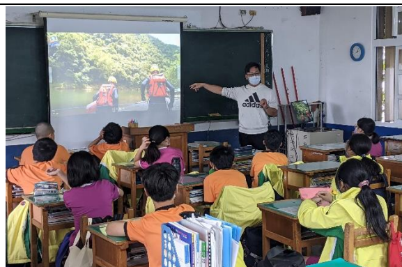
水域安全防溺自救觀念說明