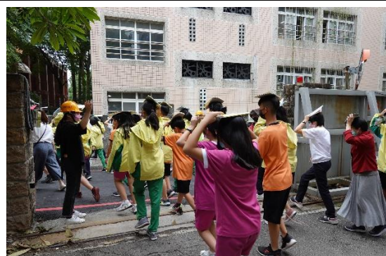
防震演練，全員實體疏散