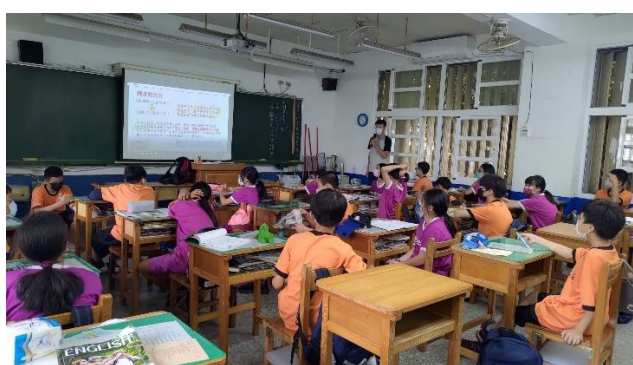
配合國家防災日宣導