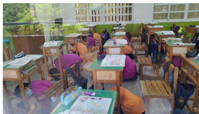
防震演練，學生就地掩護