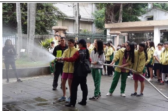
結合鄰近消防隊員進行防災教育